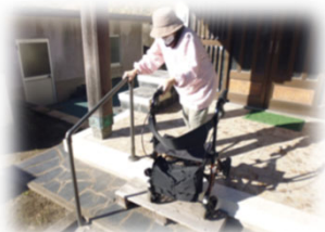
ゴミ出しに行きたい