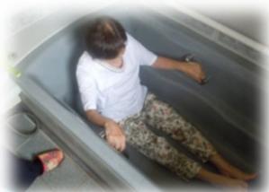
浴槽に浸かりたい