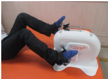
有酸素運動 てらすエルゴ